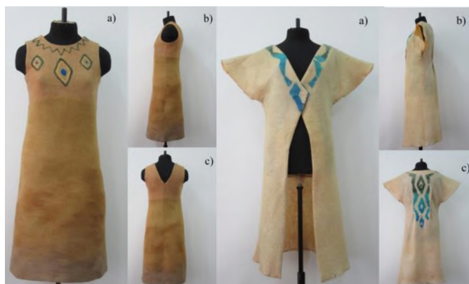
Figure 2 - demi-season nunofelt dress a)- front view b) - side view c) - back view

Products made from developed modified canvases have a number of advantages: high heat-shielding properties; aesthetic indicators; not subject to crumbling; have an original artistic solution (Fig. 2, Fig. 3).