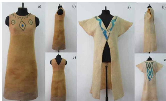
Figure 2 - demi-season nunofelt dress

Products made from developed modified canvases have a number of advantages: high heat-shielding properties; aesthetic indicators; not subject to crumbling; have an original artistic solution (Fig. 2, Fig. 3).