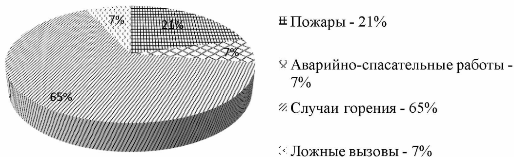
Рисунок 2 - Количество выездов службы пожаротушения и аварийно-спасательных работ г. Алматы

Службой пожаротушения и аварийно-спасательных работ г. Алматы было совершено 3528 выездов по тревоге, в том числе: на пожары – 727, на аварийно-спасательные работы – 235, на случаи горения, не берущиеся на учет как пожары – 2293, на ложные вызовы – 243 (рис. 2) [2].