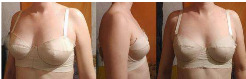
Рисунок 6 Макет бюстгалтера с центровкой и эллиптической широкой чашкой

Было выделено 3 основных формы чашки: сферическая, эллиптическая глубокая и эллиптическая широкая, которые имеют отличительные особенности в построении. На последнюю форму выполнен макет бюстгалтера (грудь малой полноты, широкой овальной формы) (рис.6).