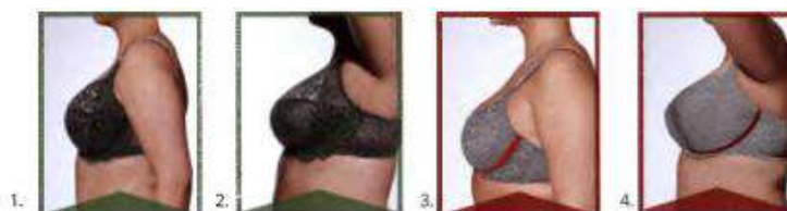
Рисунок 1– Расположение боковой кости каркаса бюстгалтера на 2 типах фигур

Многие бра фитеры утверждают, что в идеале боковая кость каркаса бюстгалтера должна уходить в середину подмышки (рис 1), особенно верно это для большой и средней груди. Но это утверждение не касается компактно расположенной груди маленького размера.