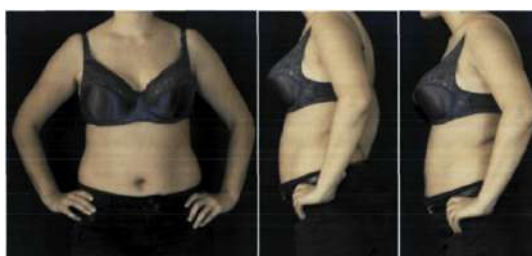
Рисунок 2 - Российский бренд «Дефиле линия: Оксана, базовый размер 80 Е Шпачковой А.В.

части кости. Красной стрелкой 1.3 и 1.4 – неправильное положение.