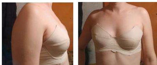
Рисунок 4 – Макет бюстгалтера по методу Ю. Стефанелло: O_{г1}=90 , O_{г3}=96 , O_{г4}=80