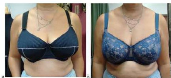
Рисунок 5 – Макет бюстгалтера а) без центровки и пропорционирования, б) с центровкой, но с чашкой меньшего размера бренд Milavitsa

На рисунке 5 представлен еще один тип груди – овальная узкая, следовательно, для такого типа груди необходимо будет совершенно другой тип каркаса: узкий и высокий. Для данного типа груди также не подходит сферическая форма чашки. Даже если бюстгалтер будет подходящего размера, но с чашечками центры груди у которых расходятся в стороны (рис 5а), многие женщины обычно предпочитают покупать бюстгалтеры меньшего размера (рис 5б), но у которых грудь собрана к центру и выглядит более аккуратной и миниатюрной.