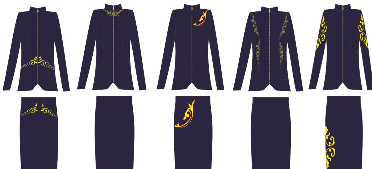
Рисунок 1 – Эскизы моделей коллекции женского комплекта.