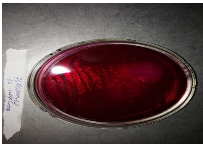
Рисунок 1 - Образец волокон с процентным соотношением 70% конопля/ 30% шерсть

вогрибковой активности процентного соотношения волокон (рис. 1-3).