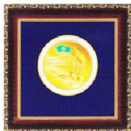
Медаль «ЛИДЕР КАЗАХСТАНА 2013»