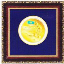
Медаль «ЛИДЕР КАЗАХСТАНА 2013»