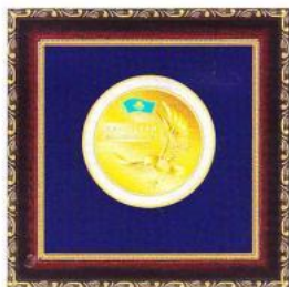
Медаль «ЛИДЕР КАЗАХСТАНА 2013»