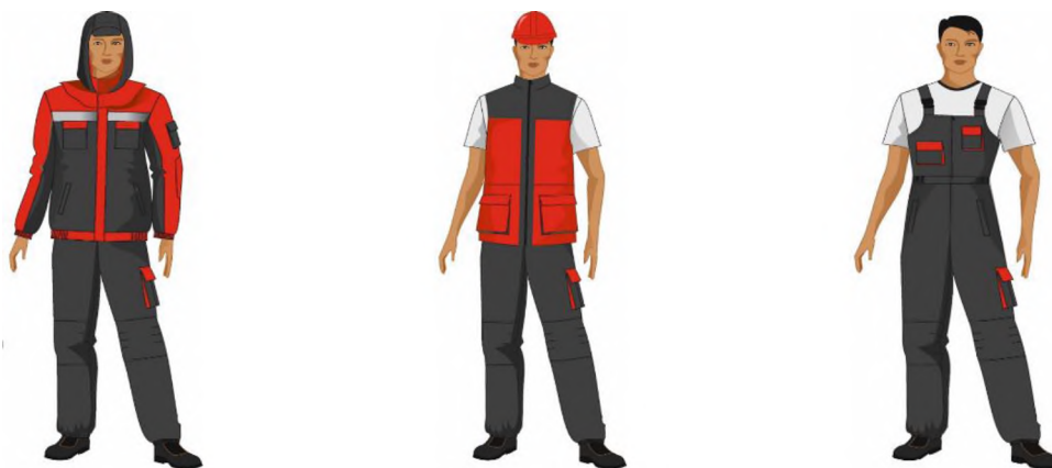
Рисунок 1 – Мужской комплект спецодежды для монтажника

Рекомендуемый комплект спецодежды характеризуется облегченностью, его простотой и удобством, разнообразием конструктивно-композиционного построения деталей. Комплект спецодежды для рабочих монтажного производства состоит из: куртки, жилета и полукombineзона, показанных на рис. 1.