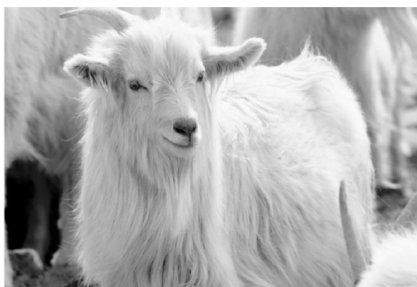
Рисунок 1 – Кашмирская коза [5]

Кашмирская коза ( Capra hircus laniger ) (рис.1) и ее пух обязаны своим названием региону – Кашмиру, расположенному на границе между Индией и Пакистаном, в западных Гималаях. В настоящее время лишь малое количество волокон и пуха получают из этого региона, сейчас он преимущественно производится в Северном Китае, Монголии, Тибете, Афганистане. Меньшие количества волокон получают в Центрально-Азиатских республиках, Иране, Австралии и Новой Зеландии [3,5].