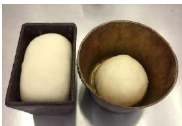
Бақылау наны сығымдалған ашытқымен