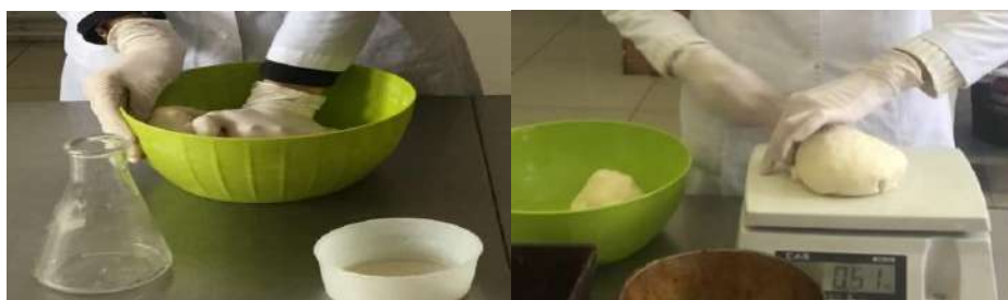
Сурет 3- Қамыр илеу, өлшеу және қамырды бөлшектеу

3-4 суреттерде нан қамырын илеу, қамыр дайындамаларын өлшеу, бөлшектеу мен соңғы жетілдіруі келтірілген.