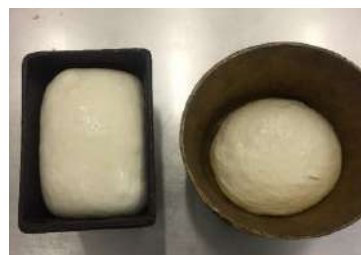
Бақылау наны сұйық ашымалмен