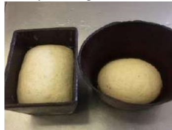
10 % қоспа қосылған сұйық ашымалмен иленген