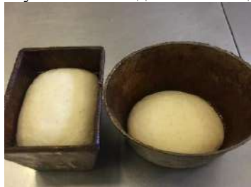
5% қоспа қосылған сұйық ашымалмен иленген