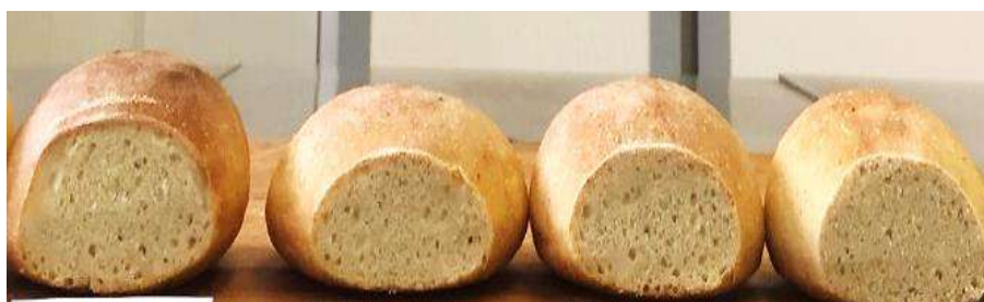
К К (а) 5% 10%

қанда: дәмі мен иісі, сыртқы түрі, кеуектілігі, нанның көлемі, өнімнің өлшемдік тұрақтылығы.