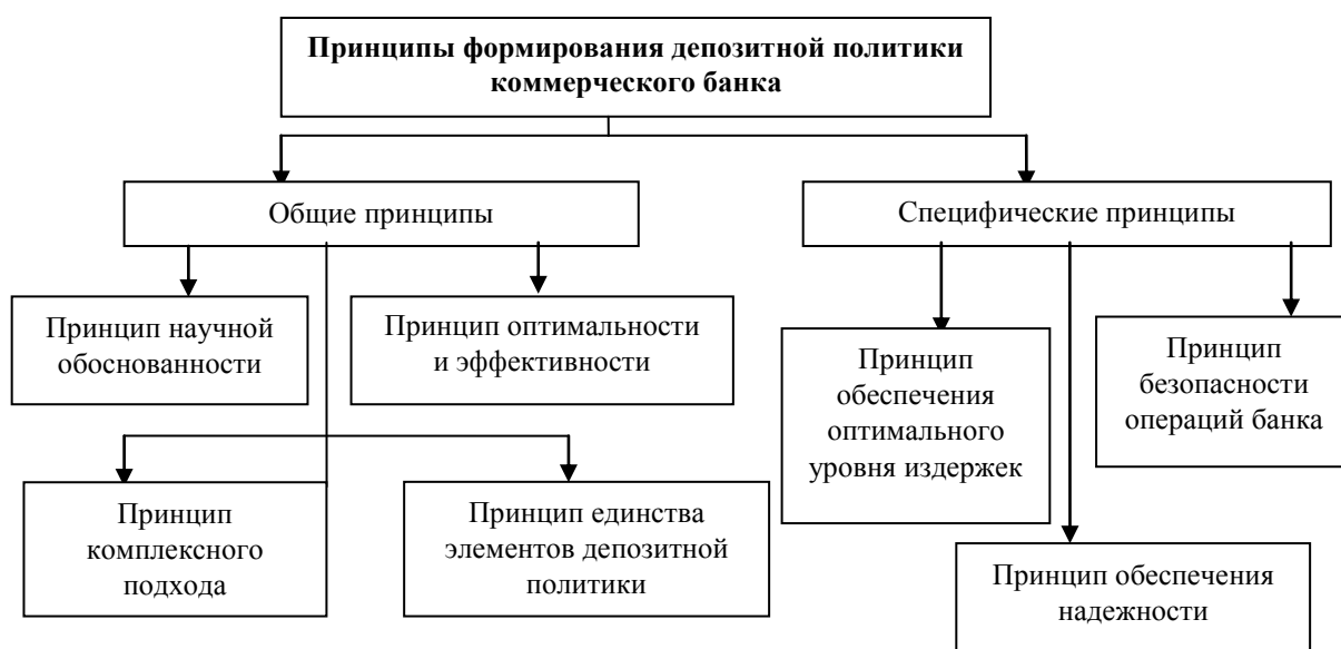
Рисунок 1 - Принципы формирования депозитной политики коммерческого банка

Под общими принципами депозитной политики понимаются принципы, единые и для государственной денежно-кредитной политики центрального банка, проводимой на макроэкономическом уровне, и для политики на уровне каждого конкретного коммерческого банка. К ним следует отнести принципы комплексного подхода, научной обоснованности, оптимальности и эффективности, а также единство всех элементов депозитной политики банка.