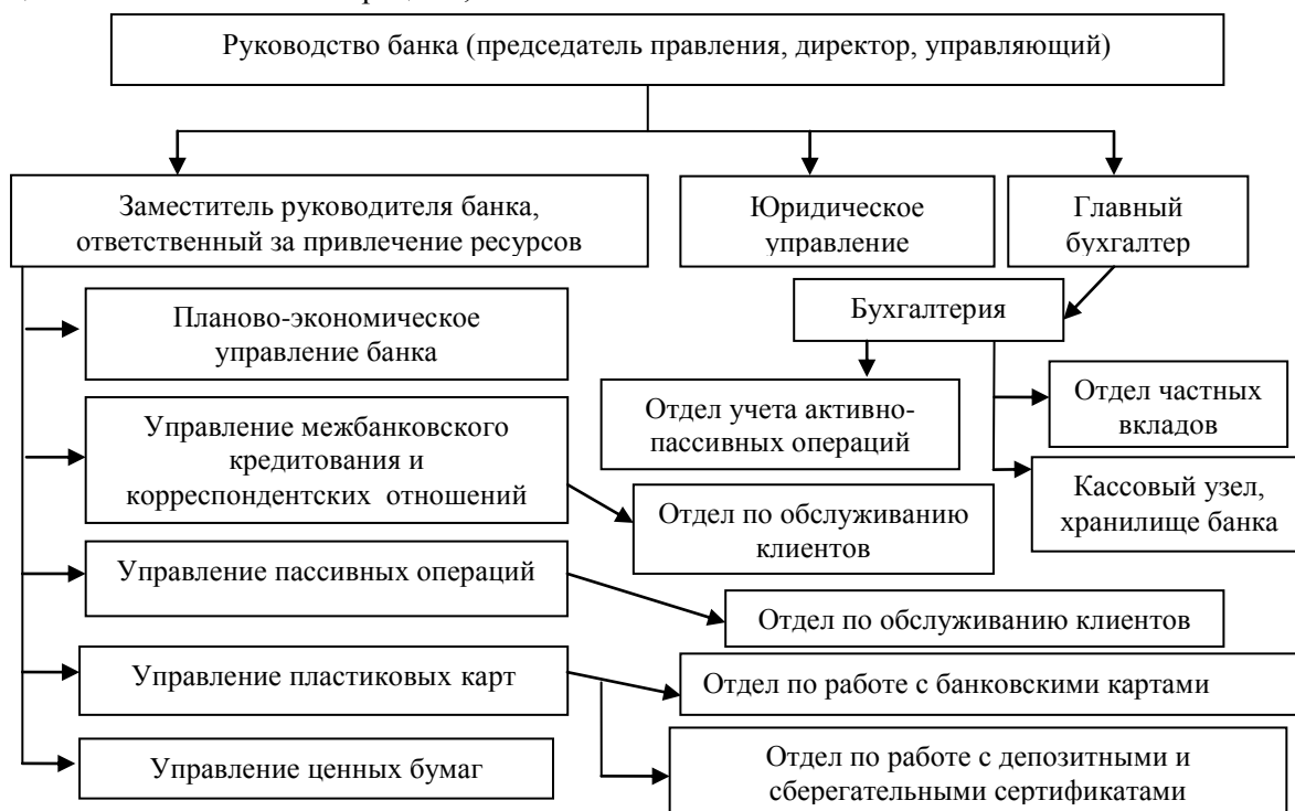
Рисунок 3 - Схема подразделений банка, участвующих в процессе формирования и реализации депозитной политики

Таким образом, депозитная политика банка определяется: во-первых, приоритетами в выборе клиентов и депозитных инструментов (сегментирование рынка), во-вторых, нормами и правилами (в том числе законодательными, инструктивными, внутри-банковскими и т.д.), регламентирующими практическую деятельность банковского персонала, реализующего эти приоритеты на практике. Качество депозитной политики и эффективность пассивных операций зависят также и от компетентности руководства банка и уровня квалификации персонала и выработкой условий депозитных договоров. На рис.3 представлена схема подразделений банка, участвующих в формировании депозитной политики [2].