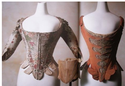
Сурет 1 - Ежелгі корсеттің түрлері [1]

денені кеудеден бастап, бөксеге дейін жауып, терлету және қызметі арқылы тұлғаны қалпына шектеулі бір уақытта келтіреді.