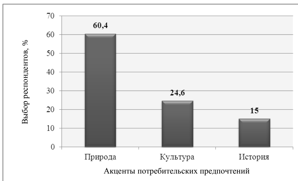
Рисунок 3 – Приоритетные акценты потребительских предпочтений, %

Была выполнена попытка выявить акценты потребительских предпочтений, которые наблюдаются со стороны иностранных туристов. На современном этапе, на рынке международного туризма наблюдаются следующие тенденции: интерес к альтернативной культуре; переход от пассивных видов отдыха и туризма к активным; экологизация мышления и как следствие интерес к экотуризму [14-16]. Поэтому одним из ведущих акцентов, часто не достаточно учтенных в казахстанском турпродукте, являются культурно-познавательные туры. При оценке акцентов потребительских предпочтений были установлены три их ключевых вида – это природа, культура и история (рисунок 3).