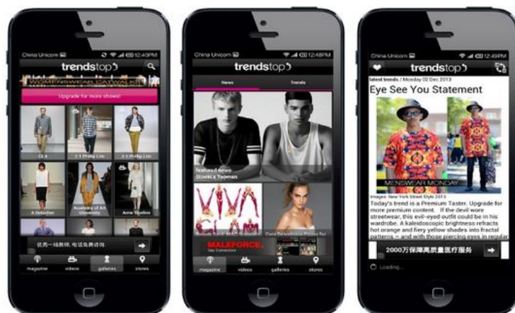
Рисунок 1 – Интерфейс приложения TRENDSTOP

Приложение TRENDSTOP создано на базе одноименного Лондонского тренд-агентства. Приложение занимается прогнозированием и полноценным освещением актуальных тенденций моды.