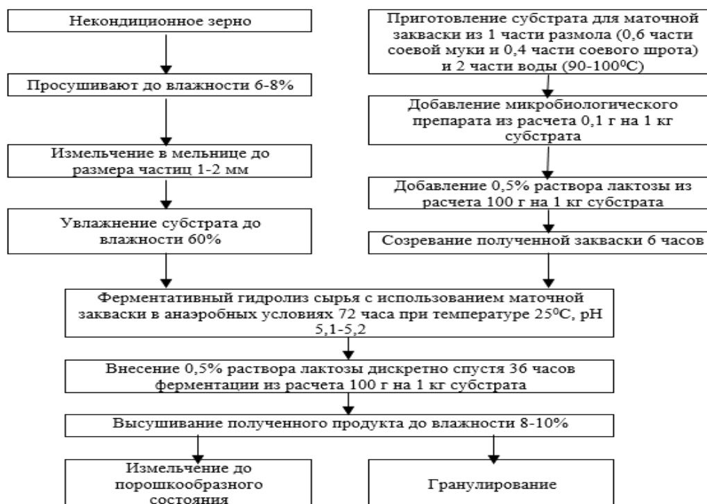
Рисунок 2 – Технологическая схема кормового продукта путем переработки некондиционного зерна с использованием закваски на основе соевой муки и шрота

Результаты исследования послужили основой для разработки технологической схемы получения кормового продукта с использованием закваски на основе соевой муки и шрота (рис. 2).