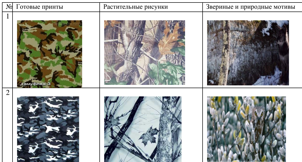
Таблица 1 – Использование рисунка для камуфляжа

Помимо общепринятого хаки (в переводе с персидского это слово означает «пыль»), основные цвета стиля милитари – серый, оливковый, горчичный, черный в сочетании с болотным, бежевый в сочетании с коричневым.