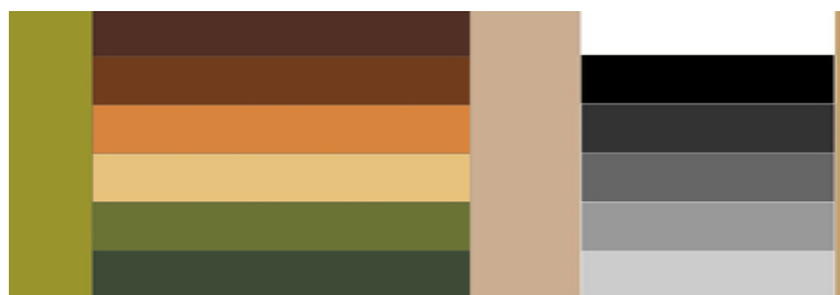
Рисунок 1 – Предпочтения детей-инвалидов и обслуживающих лиц на сочетание цветов в одежде

Результаты и их обсуждение. В результате исследования было выявлено, что большинство детей предпочитают более темные тона, такие как серый, темно-зеленый, черный и коричневый. По мнениям психологов, это зависит от их психологического состояния. Анализ результатов исследований позволил выявить потребительские предпочтения детей-инвалидов, родителей и медицинского персонала на сочетание цветов (рис.1).