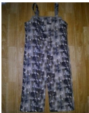
Рисунок 2 – Модель полукомбинезона

На основании проведенных исследований в специальном Реабилитационном центре для детей-инвалидов и учитывая влияние цвета на психику ребенка, была разработана модель полукомбинезона, представленная ниже (рис. 2) с разъемными замками – «молния» сбоку, обеспечивающая родителям удобство использования изделия. В эстетическом отношении внешний вид такого полукомбинезона не привлекает внимания окружающих.