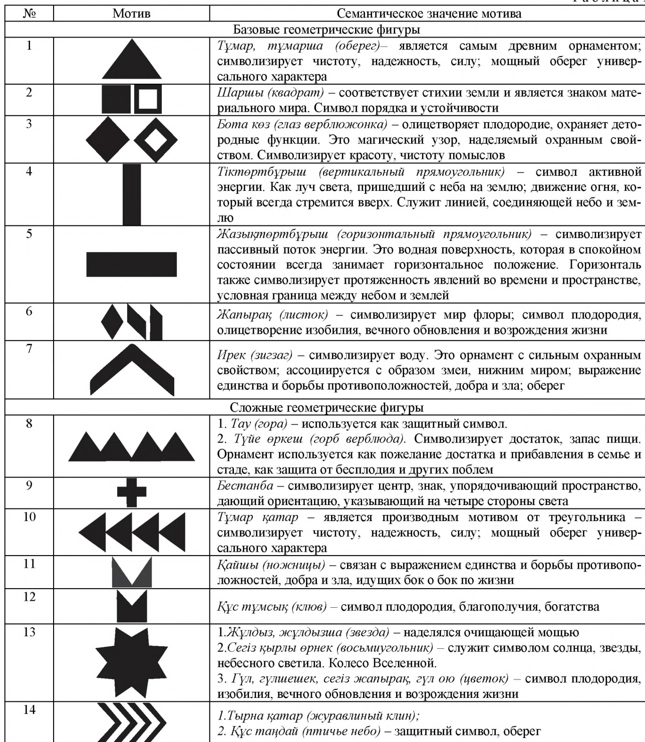
Т а б л и ц а 1

Казахское лоскутное изделие в основном представляет собой комбинацию многоцветного орнаментального мозаичного центра и однотонного опоясывающего бордюра. Все орнаментальные композиции мозаичного центра, встречаемые в казахском курак, можно разделить на три большие группы: простые, сложносоставные и современные.