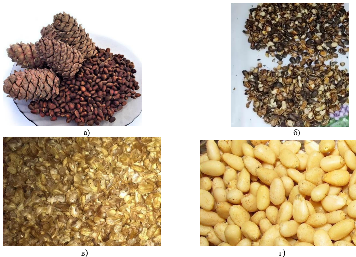
Сурет 1. Сібір балқарағайы : а) Балқарағай жаңғағы б) Қабық в) Дән айналасындағы қабықша г) Дән