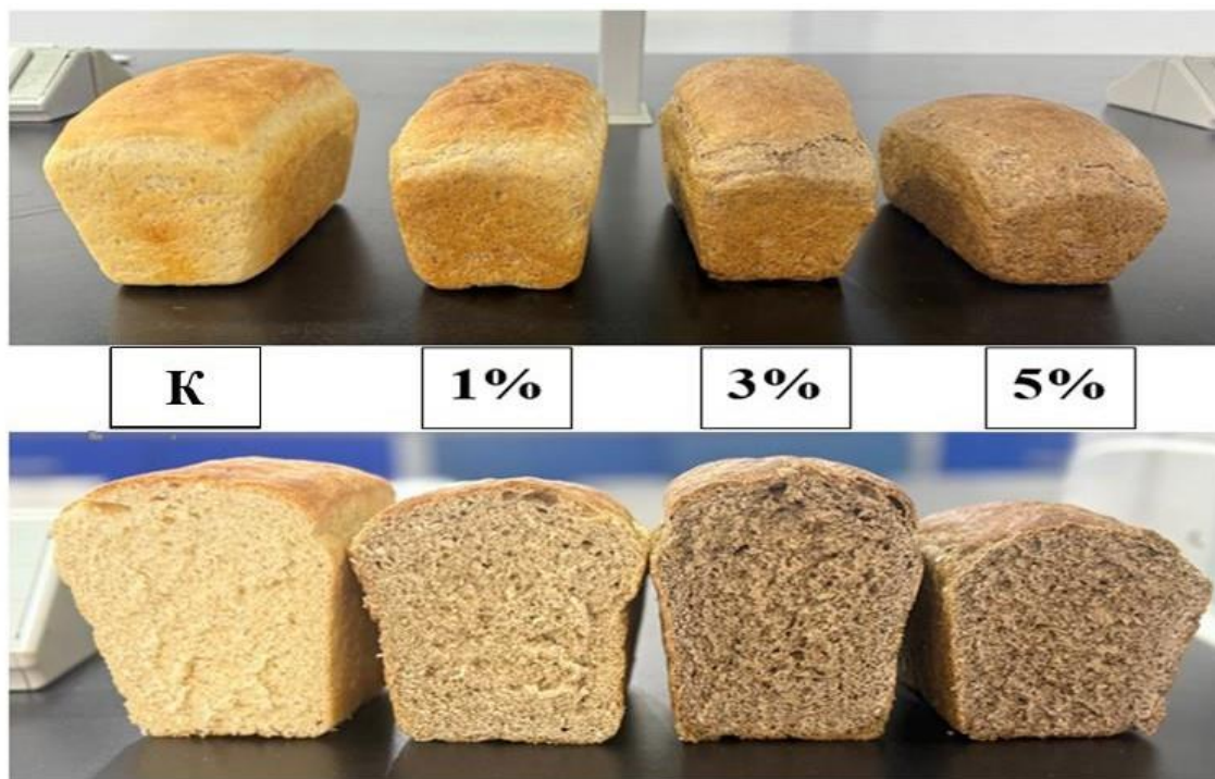
Рисунок 1. Образцы пшеничного хлеба с добавлением различных дозировок растительного порошка из лука Розенбаха.

ляла 4–5 минут. Брожение теста проводилось при температуре 40–45 °С и относительной влажности 80–85 %. Выпечка образцов хлеба осуществлялась при температуре 220–240 °С [1, 2, 7]. Внешний вид пшеничного хлеба с добавлением различных дозировок растительного порошка из лука Розенбаха (сиёхалаф) представлен на рисунке 1.