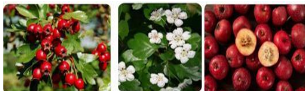
Рисунок 1. Боярышник в кустах, цветки и плоды

цированы гиперозид, кверцетин, витексин, а также хлорогеновая и кофейная кислоты. Семена растения содержат амигдалин, а мякоть плодов богата органическими кислотами, такими как виннокаменная и лимонная, а также сахарами. В плодах также отмечено высокое содержание витамина С и каротиноидов [3].